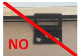
Sistema de instalación utilizado por PVA Cableado correcto 1.5 pulgadas